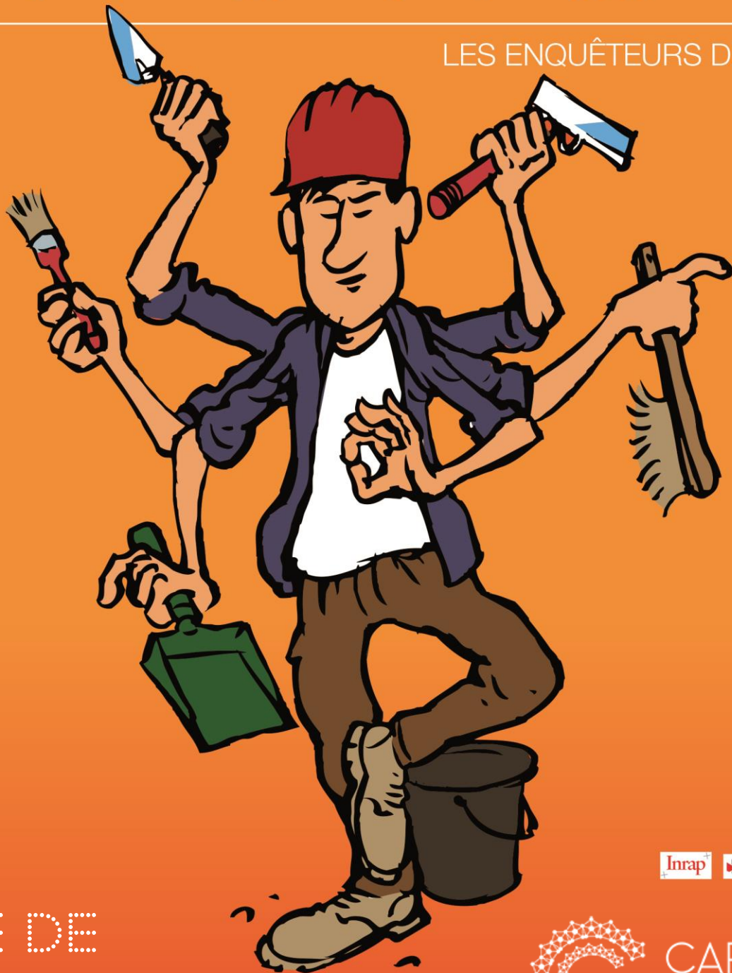
Illustration : Bertrand Ducourneau